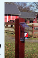
Eksempel på start

De runde cirkler med numre på kortet angiver placeringen af posterne. En post består af en ½ m høj rød træpæl med et metalskilt forsynet med postnummeret. Postens bogstavkode (3 bogstaver) kan skrives i den rigtige rubrik i kontrolkortet nedenfor.